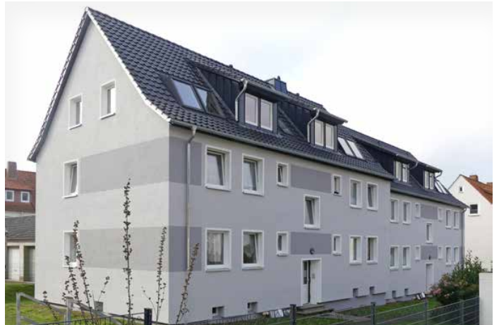
Haus nach der Modernisierung