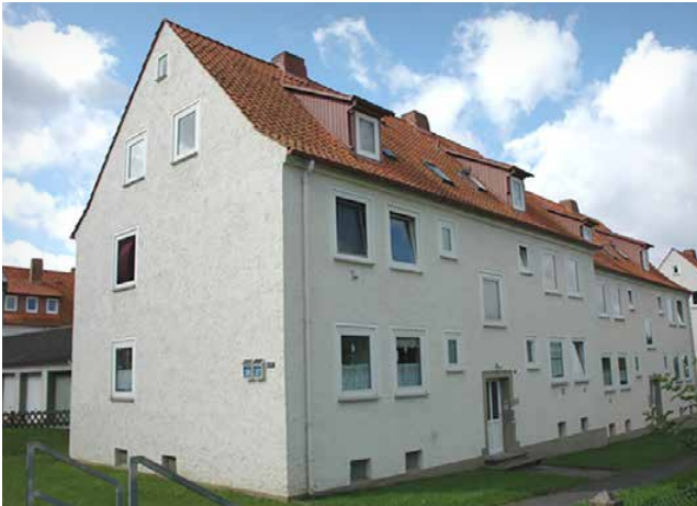
Haus vor der Modernisierung

wohnungen ist für das nächste Jahr vorgesehen, ebenso wie der Einbau einer Video-Gegensprechanlage, so dass auf dem Handy nachgesehen werden kann, wer an der Haustür geklingelt hat.